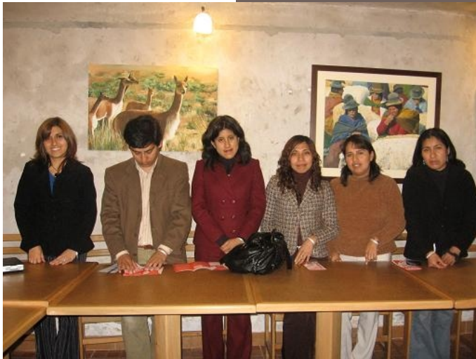
Jóvenes peruanos en evento del Stand Up against Poverty en Perú

Hasta la fecha han sido un total de 258 mujeres de organizaciones sociales de base y 353 jóvenes, los beneficiarios directos. Como parte de la experiencia, también se llegó a capacitar a 90 Micro y pequeños empresarios de SJL, 15 líderes de la Red Económica y 15 trabajadores de la Agencia Municipal. En un futuro, se espera poder llegar a jóvenes de otras comunidades, considerando los insumos y aprendizajes adquiridos a través de este proyecto.